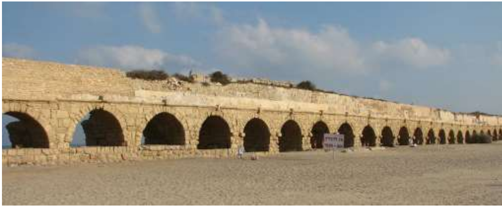
Acquedotto di Cesarea

Durante la sua permanenza c'è una sommossa che termina nel sangue, tanto che vengono inviate lettere agli ambasciatori di Tiberio, perché Pilato venga sostituito.