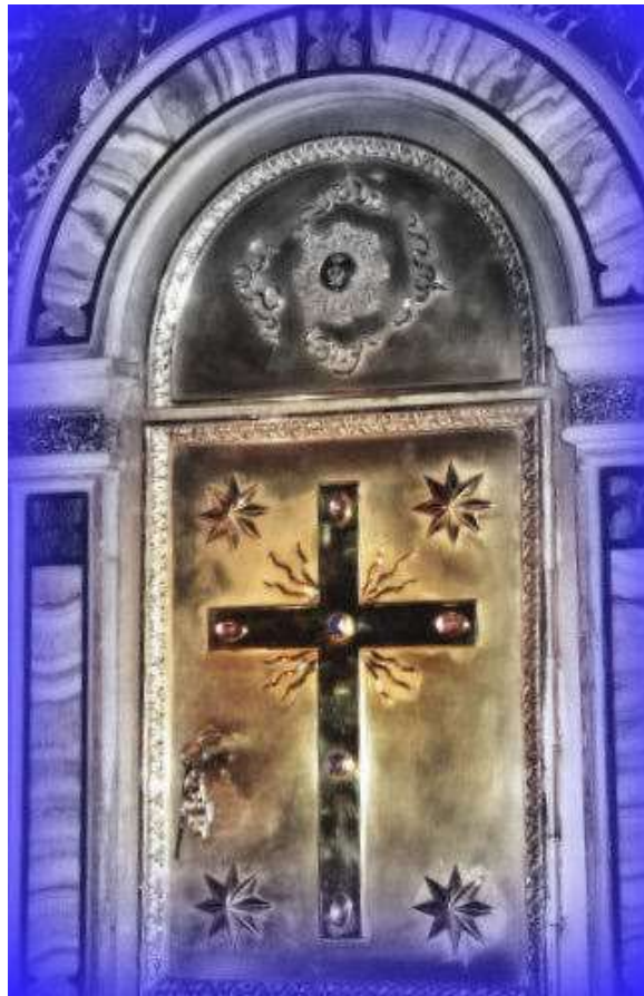
Tabernacolo della Chiesa di Nostra Signora- Roma

NEL NOME DEL PADRE, DEL FIGLIO E DELLO SPIRITO SANTO.